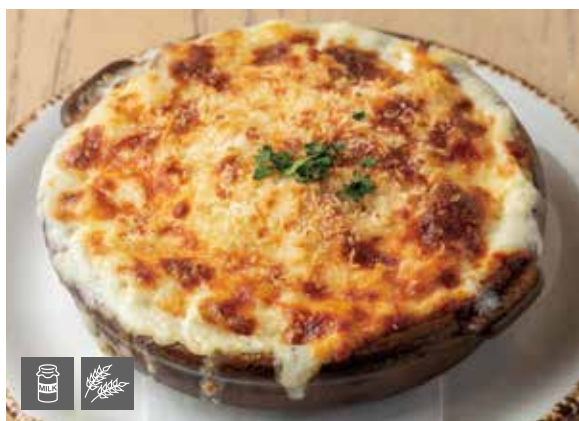
マカロニグラタン 1200 Macaroni Gratin [乳成分、小麦を含む／Includes milk,wheat]