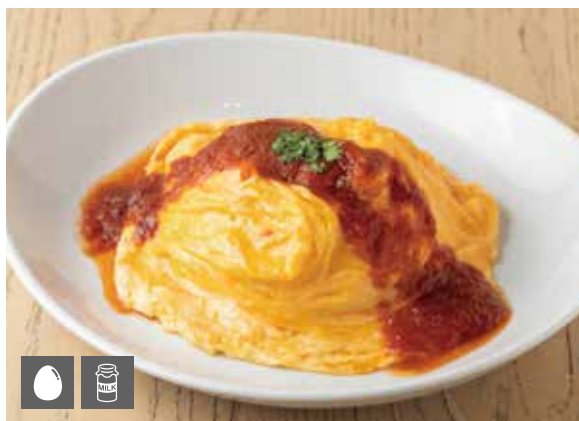
オムライス 1400 Omelette Rice [卵、乳成分を含む／Includes egg,milk]