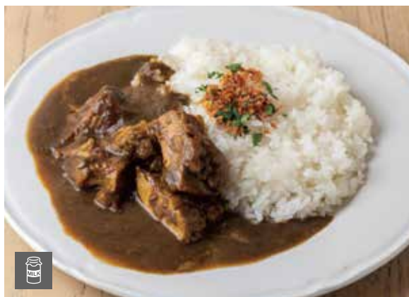
ビストロカレー 1300 Bistro Curry [乳成分を含む／Includes milk]